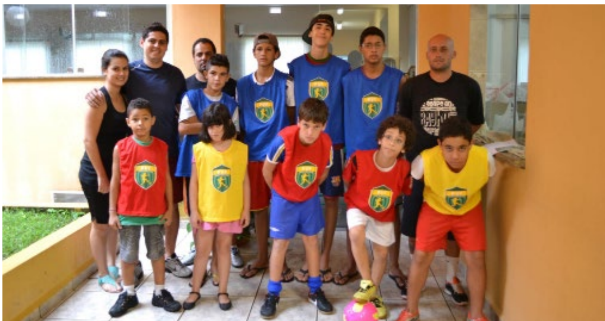
FUNDAÇÃO 9 DE MARÇO 2013

Novos desafios e diante de novas parcerias em 2015 , as aulas de Futsal foram